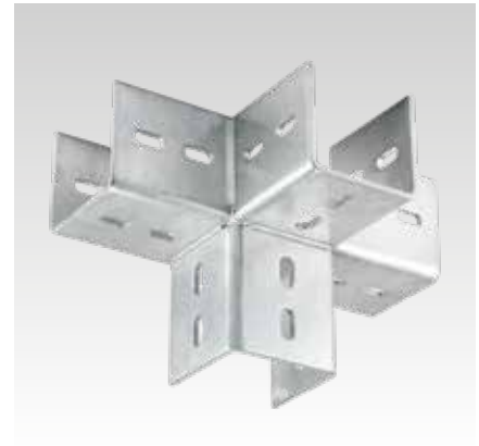
Equerre d'angle MPT 4 directions