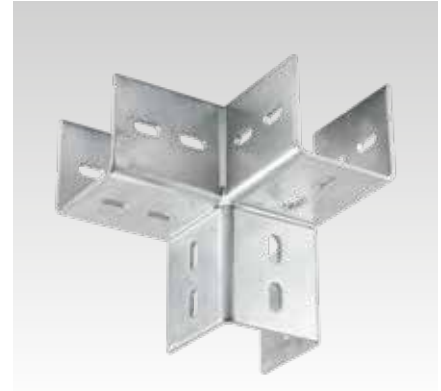
Equerre d'angle MPT