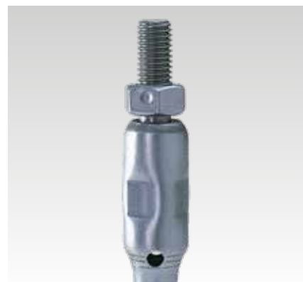
Rotule de suspension longue