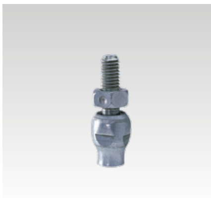
Rotule de suspension courte